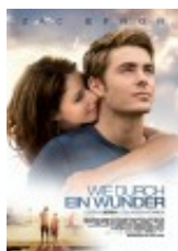
Film: Wie durch ein Wunder USA/Kanada 2010

Charlie und Sam sind nicht nur beim Segeln ein Dream Team. Charlie kümmert sich rührend um den jüngeren Bruder – auch, als dieser nach einem Autounfall stirbt. Tag für Tag spielt Charlie nach Sonnenuntergang mit Sams Geist Baseball. So findet er kaum ins Leben zurück, indem er sich dem Alltag fast entzieht. Fünf Jahre nach dem Unfall verliebt sich Charlie in die Seglerin Tess. Sie wird der Schlüssel für seine weitere Entwicklung. Das Thema des Films ist Geschwistertrauer und wie sie möglicherweise verlaufen kann.