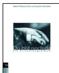
Marie-Thérèse Schins, Joachim M. Huber (Fotos): Du bist noch da – ein Erinnerungsalbum 127 Seiten

Dieses Buch soll Menschen Mut machen für die Begegnung mit Trauernden, denn wir begegnen überall trauernden Menschen. Es bietet Orientierung und Information, beantwortet Fragen und Anliegen zum Thema Trauer.